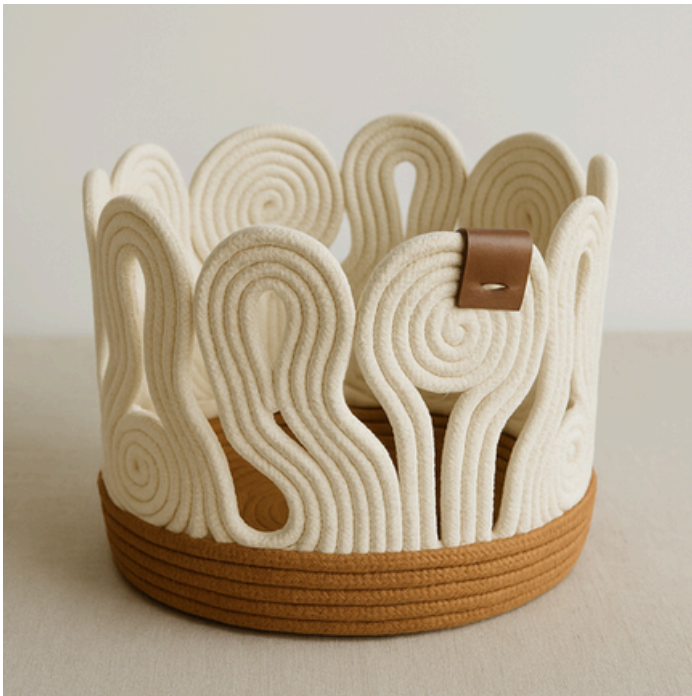
NAGLAR - BARCO MÍTICO DEL RAGNAROK

Cesta ceremonial con oso tallado a mano. El oso simboliza fuerza, protección y liderazgo en la cultura nórdica. Tejido robusto con detalle escultural único: cada pieza cuenta una historia de poder.