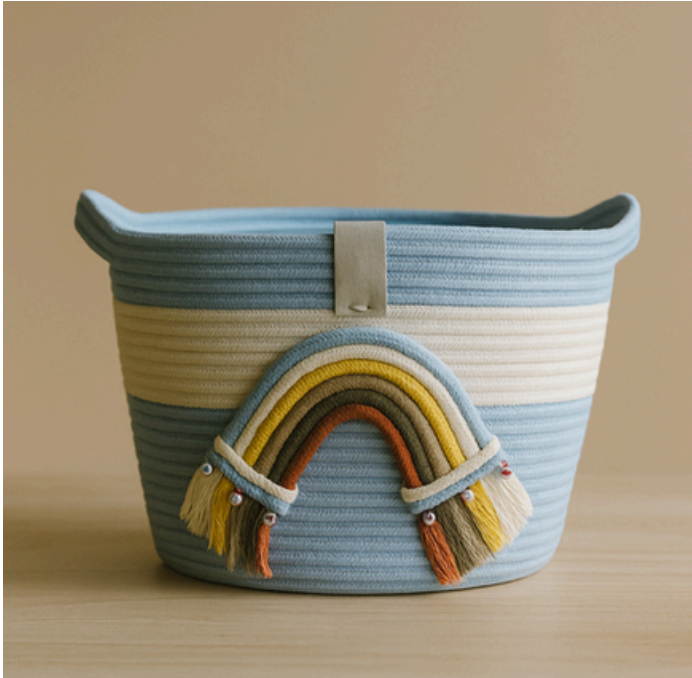
FREYDIS - NAVÍO EXPLORADOR