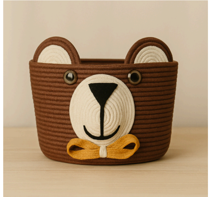
DRAKKAR - BARCO DE PROTECTORES

Cesta con arcoíris tejido a mano y tapa en contraste. Inspirada en Freydis Eiríksdóttir, la exploradora vikinga que desafió límites. Pieza statement que celebra el color, la geometría y la narrativa nórdica.