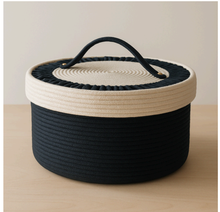
VALQUIRIA - NAVÍO DE LAS GUARDIANAS

Cesta ceremonial con forma de corona y flecos rituales. Inspirada en Naglfar, el barco legendario del Ragnarök. La pieza más elaborada de la colección: arte funcional para espacios de diseño consciente.